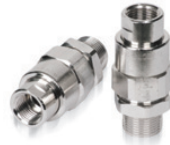
Уплотнительный кабельный ввод